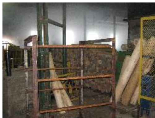
На фото: материал для подачи в рубительную машину ОАО «ГОМЕЛЬДРЕВ» BRUKS DH-V 300/400x800 L-3+2WT с главным мотором мощностью 250 кВт

Концерн BRUKS уверен в успешной реализации данного проекта и рассчитывает на повышенный спрос на подобное оборудование со стороны белорусских предприятий и в дальнейшем – «послекризисный» спрос на фанеру как в Европе, так и в России растёт большими темпами и прогнозируемо будет расти и дальше.